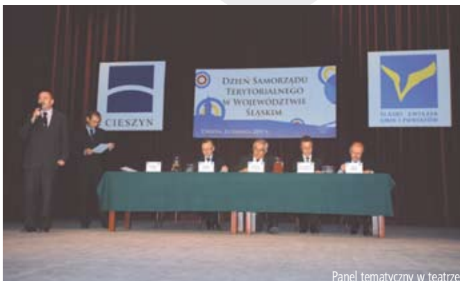
Panel tematyczny w teatrze