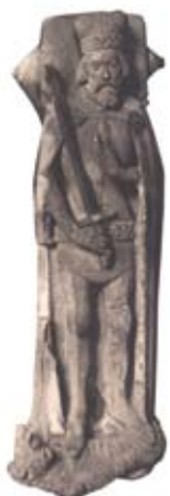
Posąg nagrobny Przemysława I Noszaka

Tekst pochodzi z ulotki pn. „VIA SACRA. Kościoły i klasztory w Cieszynie i Czeskim Cieszynie” wydanej przez Biuro Promocji i Informacji UM. Można ją otrzymać w Cieszyńskim Centrum Informacji (Ratusz, parter).