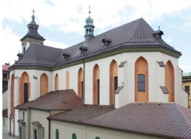
Zdjęcie z 2008 r.