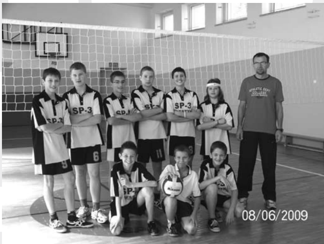
Drużyna siatkarzy wraz z trenerem