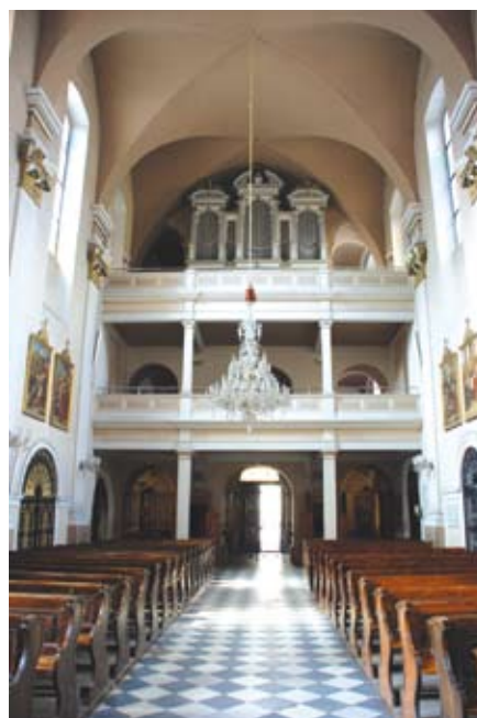
Widok na chór muzyczny, 2008 r.