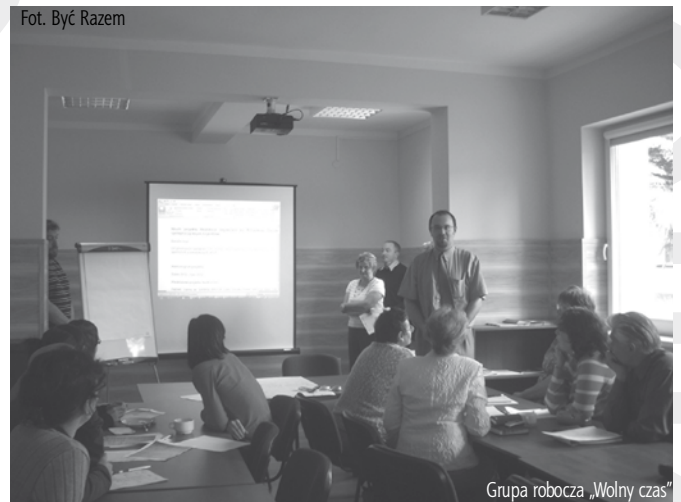
Grupa robocza „Wolny czas”