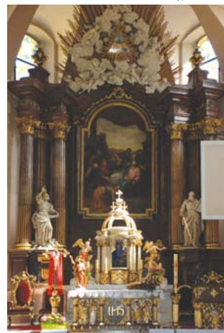
Ołtarz główny z obrazem Matki Bożej Cieszyńskiej, 2008 r.

Zapraszamy Czytelników do współredagowania tej strony. Prosimy o nadsyłanie ciekawostek związanych z Cieszynem (np. anegdot, przepisów kulinarnych, zdjęć, dokumentów, wzorów rękodzieła artystycznego itp.), które mogłyby zainteresować innych i wzbogacić wiedzę o naszym mieście. Gwarantujemy zwrot wszystkich otrzymanych materiałów.