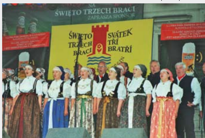
Występ Zespołu Pieśni i Tańca Ziemi Cieszyńskiej