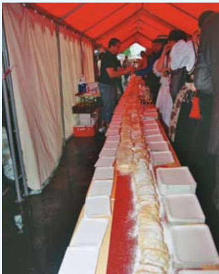
Strudel na Moście Przyjaźni

Za udzielenie pomocy i wsparcie serdecznie dziękujemy. COK