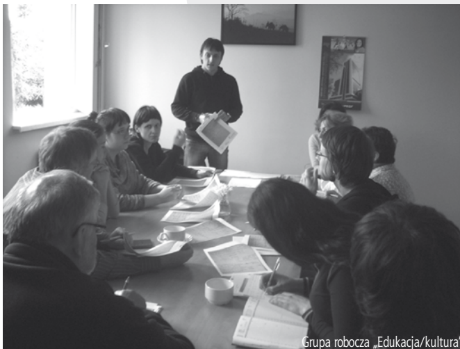
Grupa robocza „Edukacja/kultura”