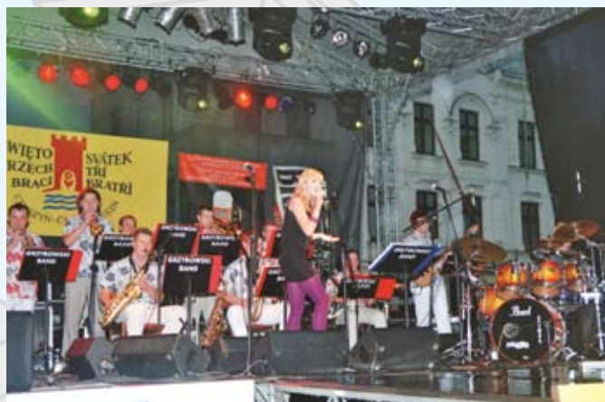
Koncert zespołu Grzybowski Band