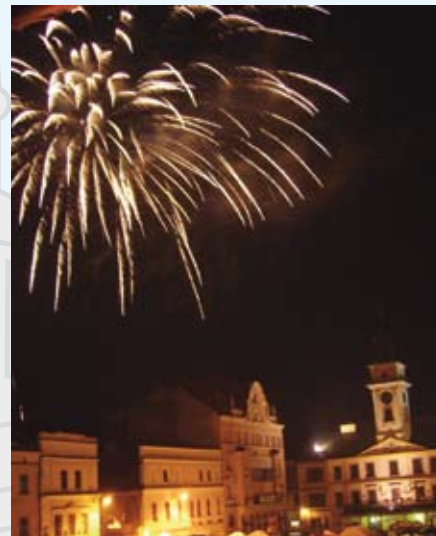
Pokaz ogni sztucznych